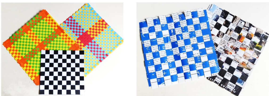
Slika 3: Prepletanje trakov različnih barv

S prepletanjem trakov različnih barv lahko sestavite poljubne vzorce (glej slika 3).