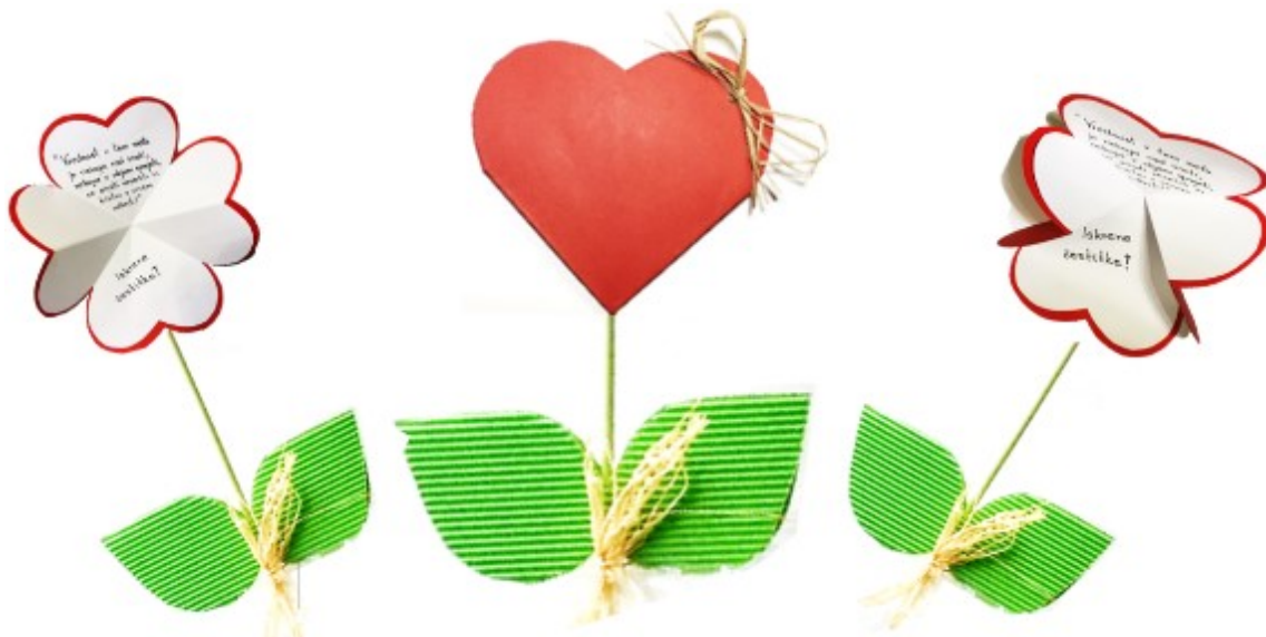
Slika 1: Valentinka – izdelek

Izdelajmo si rožico v obliki srčka, napišimo voščilo in jo poklonimo svojim najdražjim.